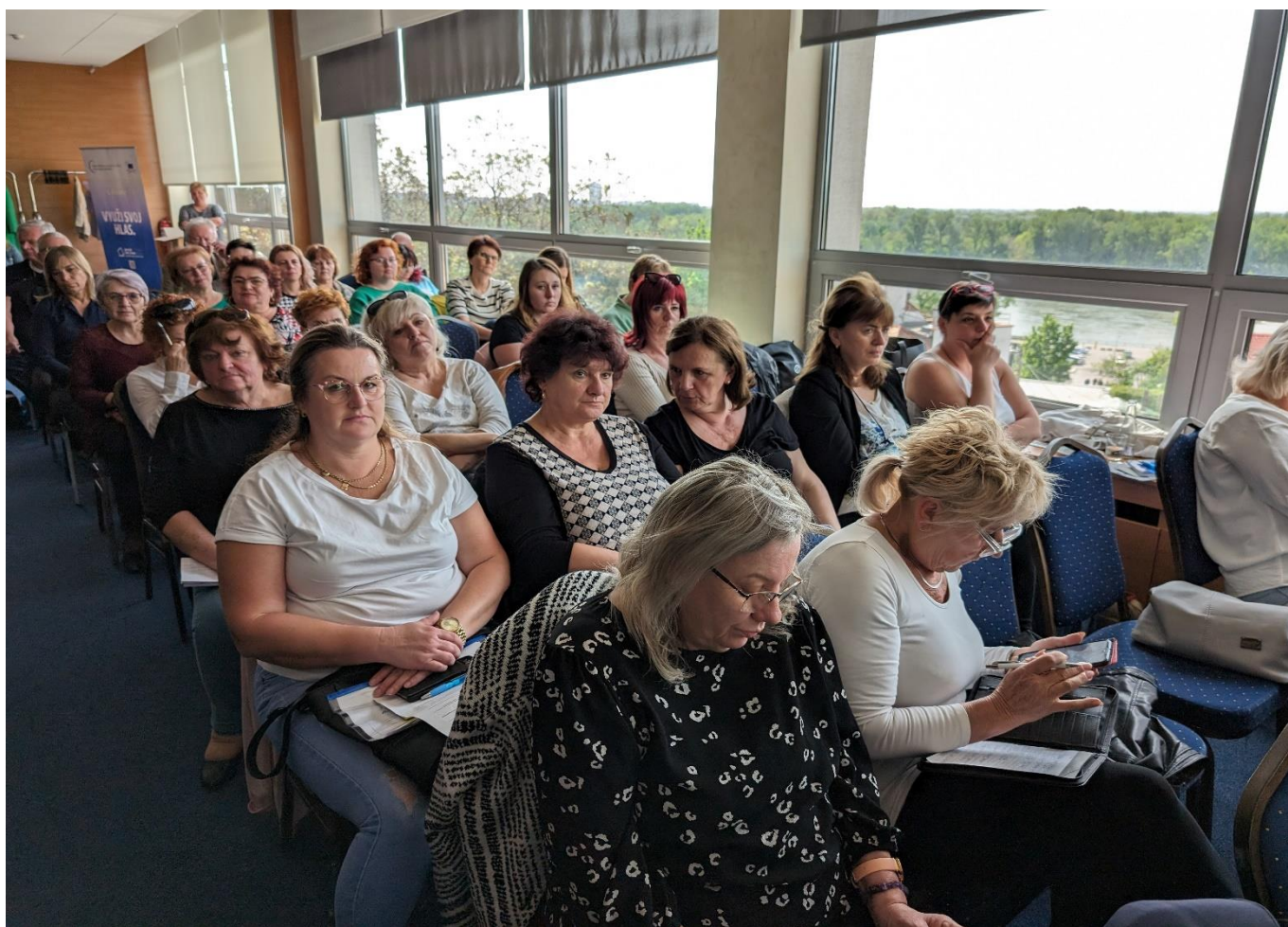
Konferencia predsedov Základných odborových organizácií SOZ ZaSS 11. apríla 2024