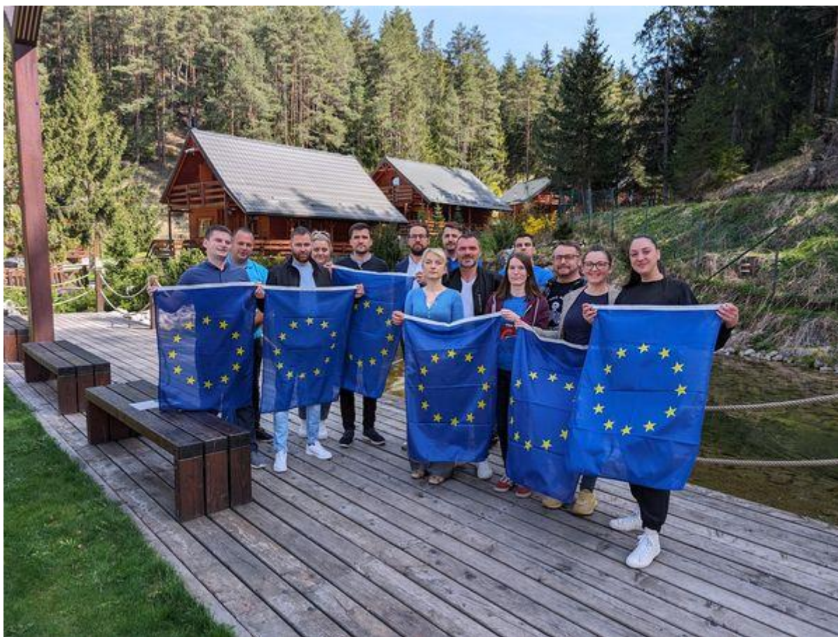
Členovia zasadnutia Rady mladých KOZ SR v Lopušnej Doline