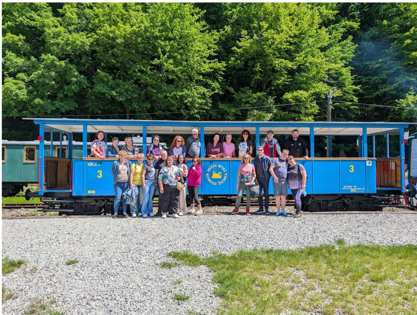
Neformálne stretnutie Výkonného výboru SOZ ZaSS a Výkonnej rady OSZSP ČR v Košiciach